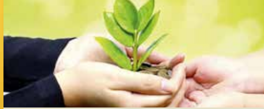
N-VA wil waardebon voor lokale handelaars (p.2)