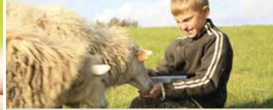
Subsidie voor Damse zorgboerderijen (p.2)