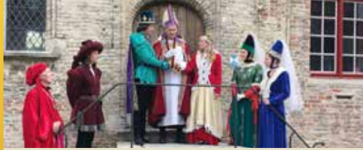
Dams erfgoed verdient meer aandacht (p. 2)