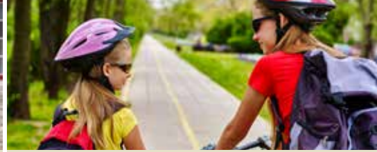
Mobiliteitsplan voor Moerkerke moet beter (p. 3)