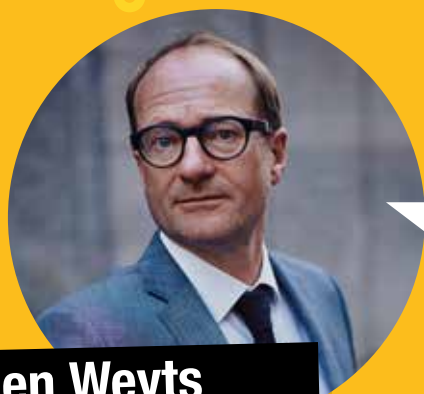
Ben Weyts Vlaams minister van Onderwijs

Veel Vlamingen snakten naar de heropening van de scholen. Heel wat ouders wilden hun kinderen weg van achter de pc thuis, en weer op de schoolbanken. Leerkrachten misten de kinderen. En onze jongeren misten hun vrienden.