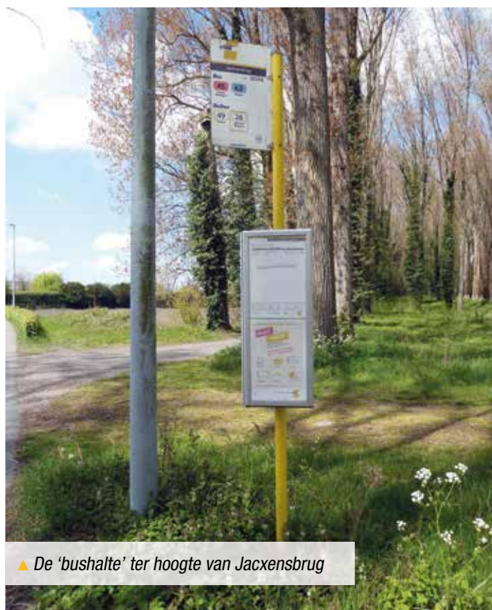
▲ De 'bushalte' ter hoogte van Jacxensbrug

Met dit charter onderschrijft de gemeente de noodzaak van een inclusieve mobiliteit.