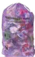
N-VA wil paarse vuilniszak p. 2