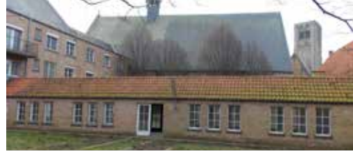
Wat met de OCMW-site? p. 3