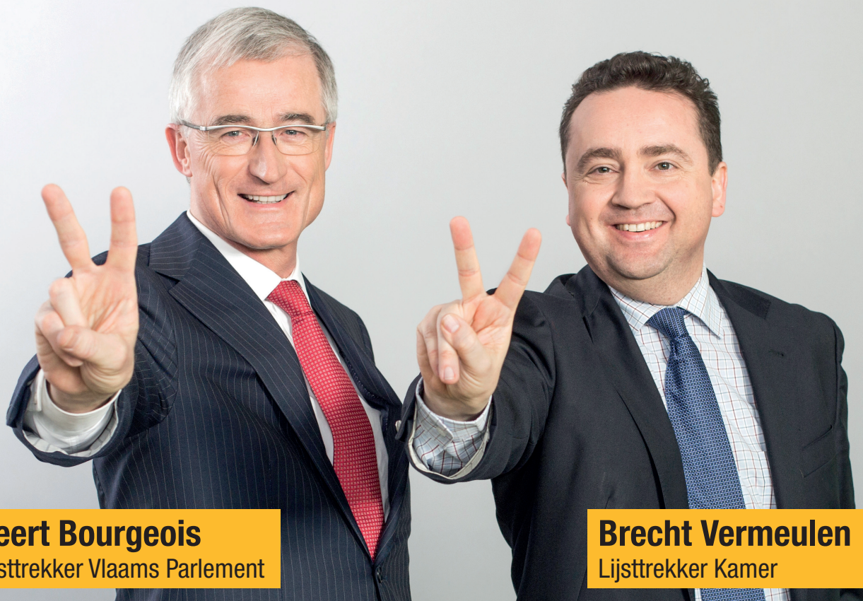
Geert Bourgeois Lijsttrekker Vlaams Parlement