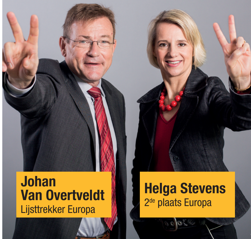
Johan Van Overtveldt Lijsttrekker Europa

De N-VA wil dat de verschillende landen van de EU hun identiteit kunnen bewaren. De EU moet niet over alles beslissen. Een Verenigde Staten van Europa, een Europese superstaat, is dus géén goed idee. De Unie moet groeien van onderuit en mag niet van bovenaf worden opgelegd.