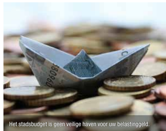
Het stadsbudget is geen veilige haven voor uw belastinggeld.

Na jaren van euforie met een 'het kan niet op'-beleid, volgt nu de kater. Het stadsbestuur oogst de gevolgen van investeren zonder ook maar één eurocent subsidie, en zonder enige vorm van langetermijnvisie. Onder meer de kosten van de Cultuurfabriek wegen zwaar door. De bouw en het openhouden hiervan kostten al meer dan 10 miljoen euro aan de Damse belastingbetaler en het einde is nog niet in zicht.