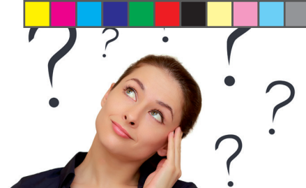
Denk mee over toekomst gemeente! p. 3